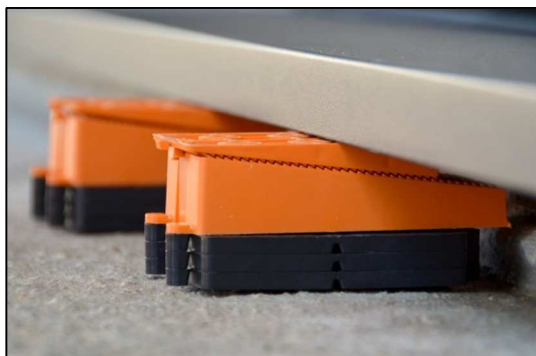
La cale crantée Jouplast 170 mm clippée aux cales plates.